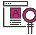
Granskning av kandidater